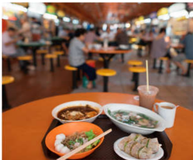
ホーカー (屋台街) とローカルフード