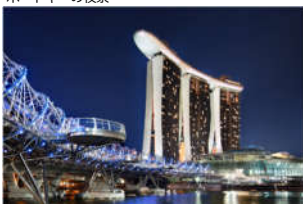
マリーナベイ夜景